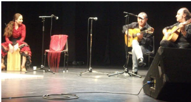
Le groupe « La farola » a fait admirer son talent.