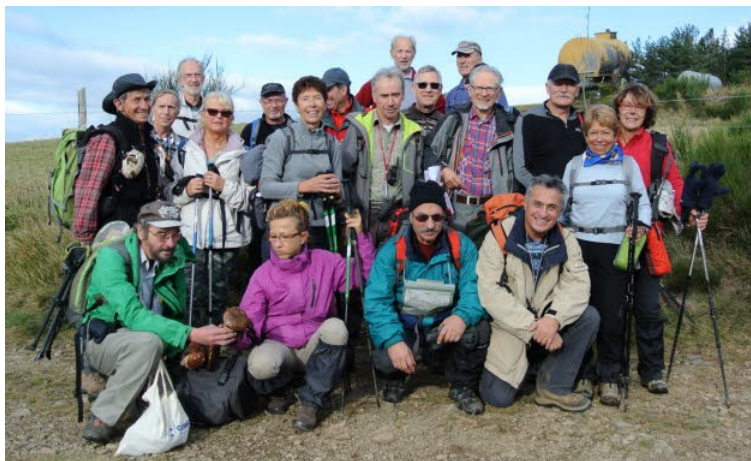
Petite halte pour la pause déjeuner à mi-parcours.

Testé pour vous. Tous les lundis, les passionnés du club rando des centres sociaux de Meyzieu partent sur les petits chemins de la région. Nous les avons suivis dans le Pilat... pour une sortie tonique.